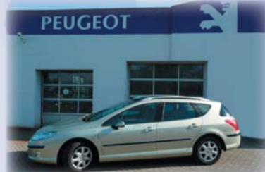
Peugeot 407 SW

407 SW 2.0 HDi Premium, (100/136 kw/k), r.v. 2006, 19 000 km, 449.000 Kč