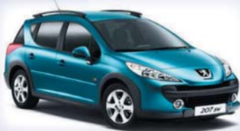
Peugeot 207 SW